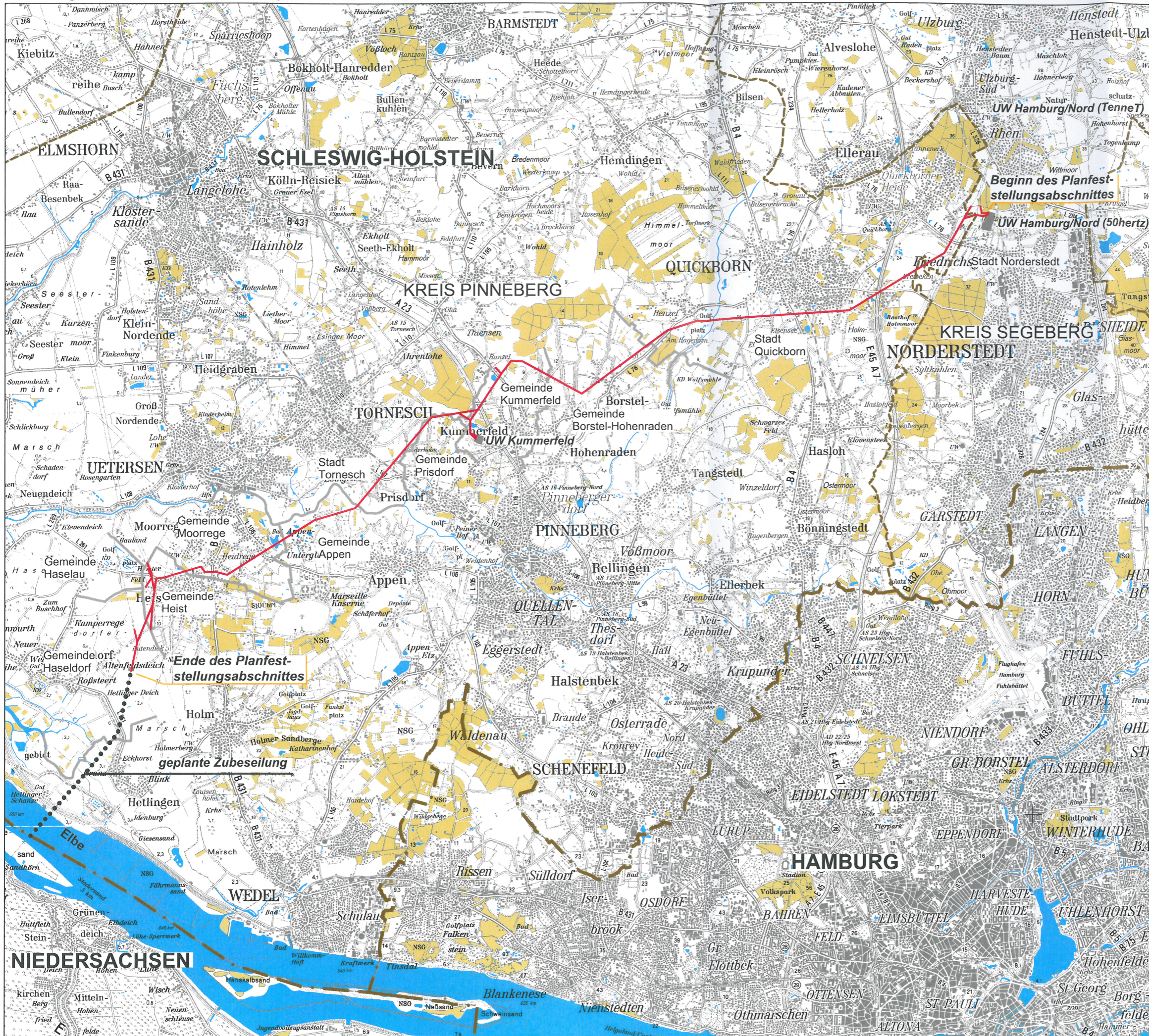
Abbildung 1: Übersicht Planfeststellungsabschnitt