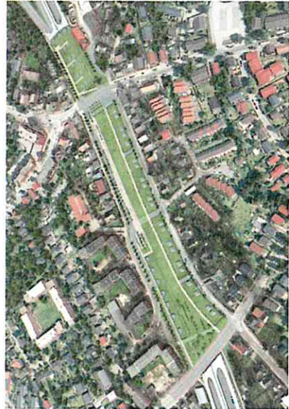
Das Ziel vor Augen. Der fertige Lärmschutzdeckel in Schnelsen.

Parallel zum ersten Vollsperrungs-Wochenende finden am 21. Juni der „Hella Halbmarathon“ sowie die „Fahrad-Sternfahrt“ in Hamburg statt. Bei der Anreise zu beiden Veranstaltungen kann es durch die Sperrung zu Verzögerungen kommen. Bitte informieren Sie sich auf den Internetseiten www.hamburg-halbmarathon.de und www.fahradsternfahrt.info über Streckenverläufe und mögliche Einschränkungen. Gut ist, dass beide Veranstaltungsrouten nicht über die innerstädtische Ausweichstrecke verlaufen.