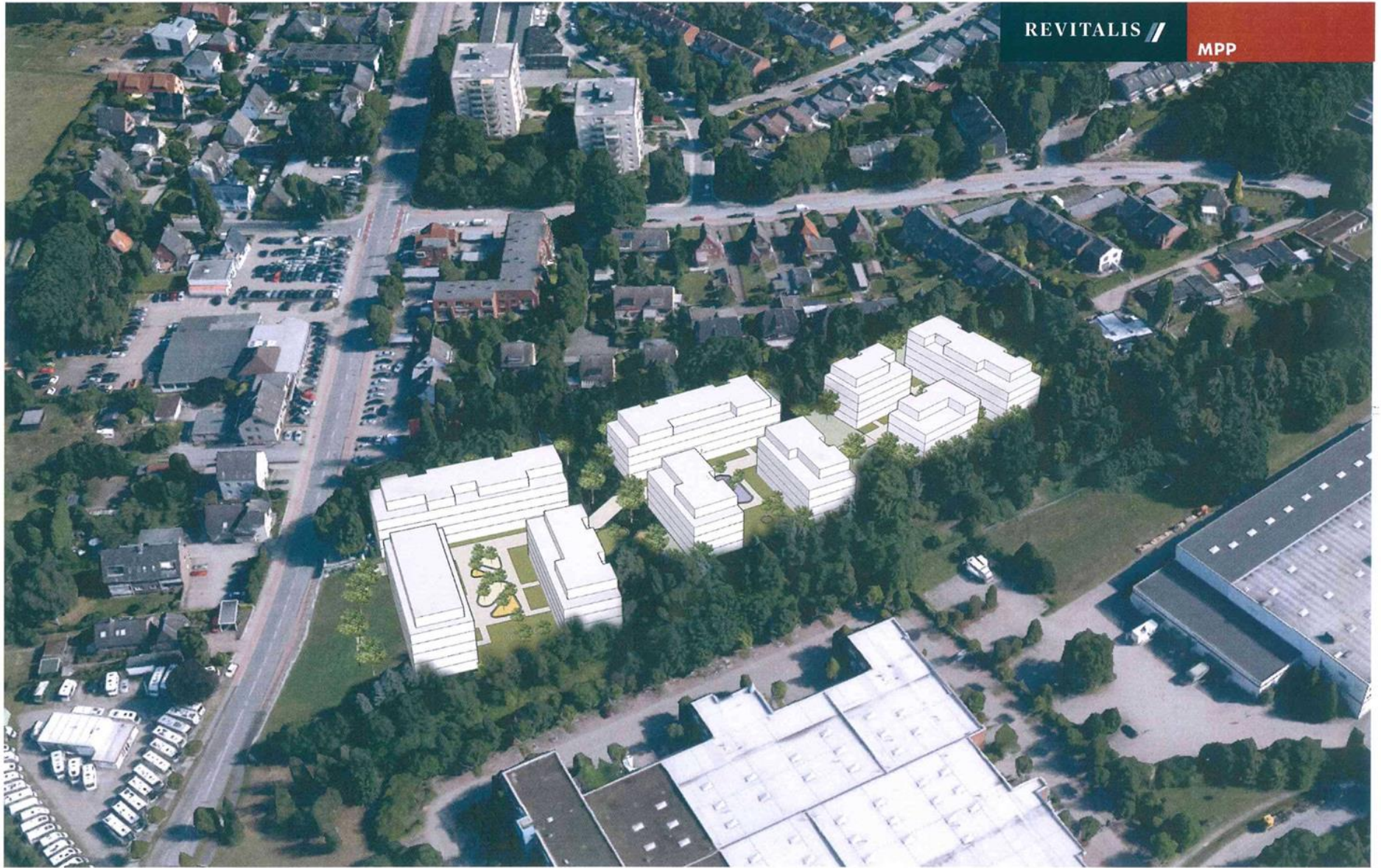
KONZEPT C Vogelperspektive