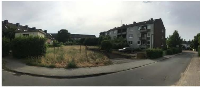
Bestand vom Tucheler Weg