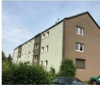
Bestand vom Stonsdorfer Weg