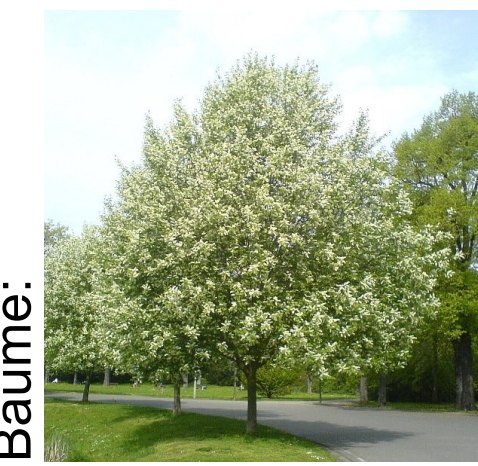
Kleinkronige Bäume: Prunus padus 'Schloss Tiefurt'