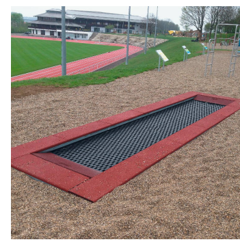
Trampolin - Track