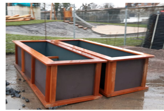
Hochbeete Bangkirai und Siebdruckplatten