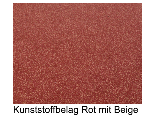
Kunststoffbelag Rot mit Beige