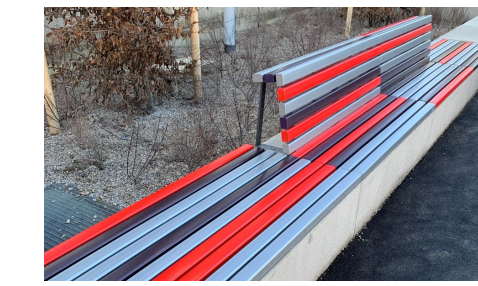
Bänke mit Acrylauflagen