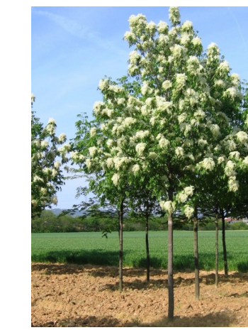
Fraxinus ornus 'Louisa Lady'