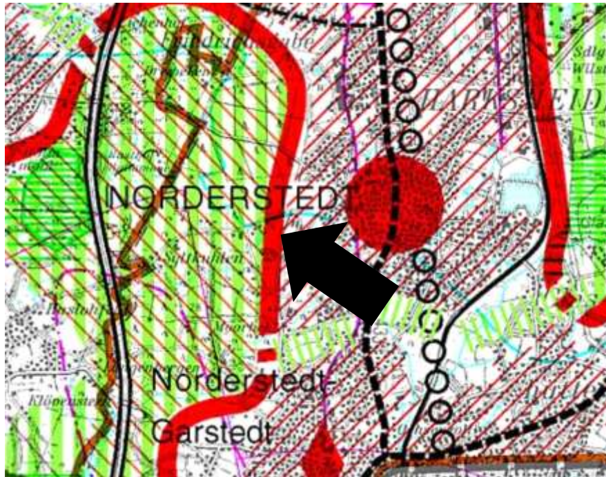
Abbildung: Ausschnitt aus dem Regionalplan, 1998

Der Regionale Grünzug im Bereich des B-Plan-Gebietes sorgt für eine Abgrenzung der Siedlungslage entlang der Siedlungsachse. Des Weiteren wird der Naherholungsraum besonders für die Norderstedter Bevölkerung langfristig gesichert.