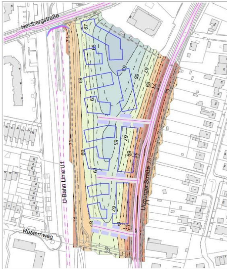
Nebenkarte 1 mit maßgeblichen Außenlärmpegeln gemäß DIN 4109:2018-01