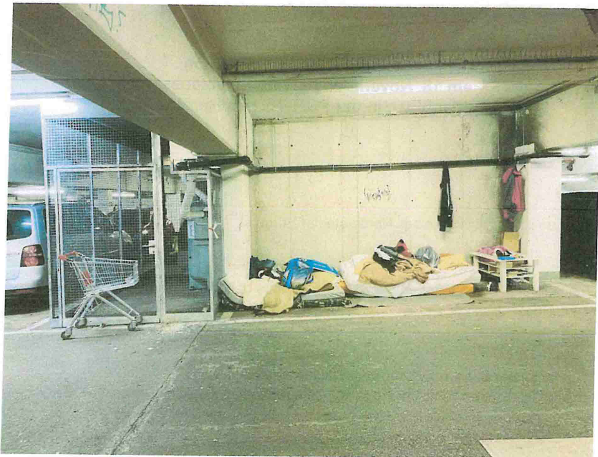
Ein schlichtes Bett im ersten Stock