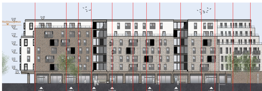
Abb.: Ansicht des Vorhabens von der Berliner Allee

Im Plangebiet soll ein zur Umgebung weitestgehend geschlossener Gebäudekörper ausgebildet werden. Diese Bauweise wird durch den ebenerdig ausgebildeten Sockel und eine darauf aufbauende sechsgeschossige Blockrandbebauung gewährleistet und durch die Begrenzung auf sieben Geschosse als Höchstmaß erreicht. Zur Berliner Allee zeigt sich somit ein insgesamt siebengeschossiger Blockrand, der im Erdgeschoss durch publikumsaffine Nutzungen eine Öffnung nach Außen erfährt, ansonsten aber nach Innen orientiert ist.