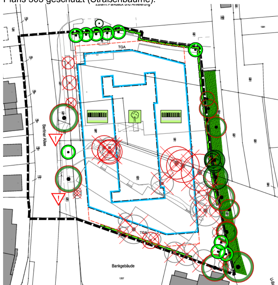
Abb.: Erhaltung und Wegfall von Bäumen

Relevantere Verluste treten mit der Beseitigung des Altbaumbestandes auf den Baugrundstücken sowie mit der Überplanung von 3 der straßenbegleitenden Bäume ein. Die entfallenden Baumbestände unterliegen nicht nur der städtischen Baumschutzsatzung, sondern sind teilweise auch durch die Erhaltungsfestsetzung des geltenden B-Plans 303 geschützt (Straßenbäume).