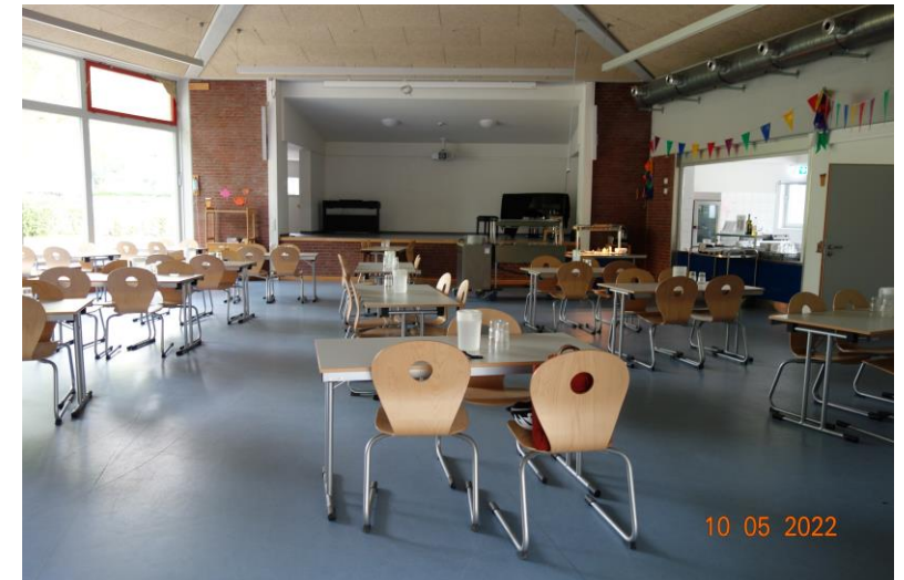
Veranstaltungsraum bei Vorabbesichtigung