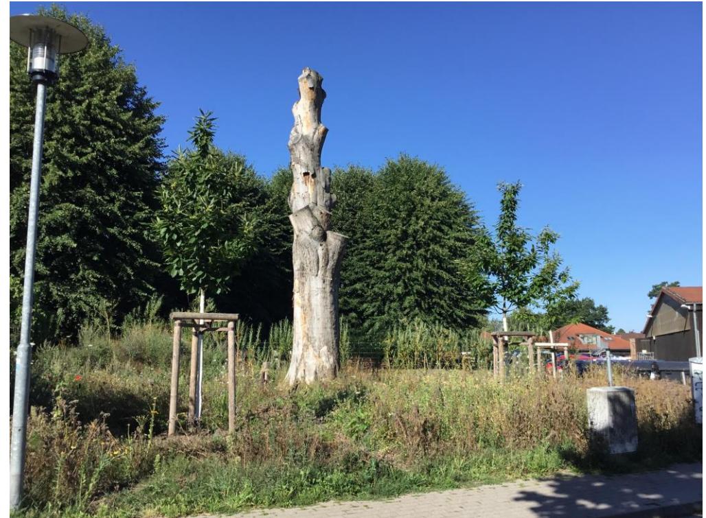
Blick auf die neu gepflanzten Ess-Kastanien, abgestorbenes und gekapptes ND mittig im Bild, August 2022