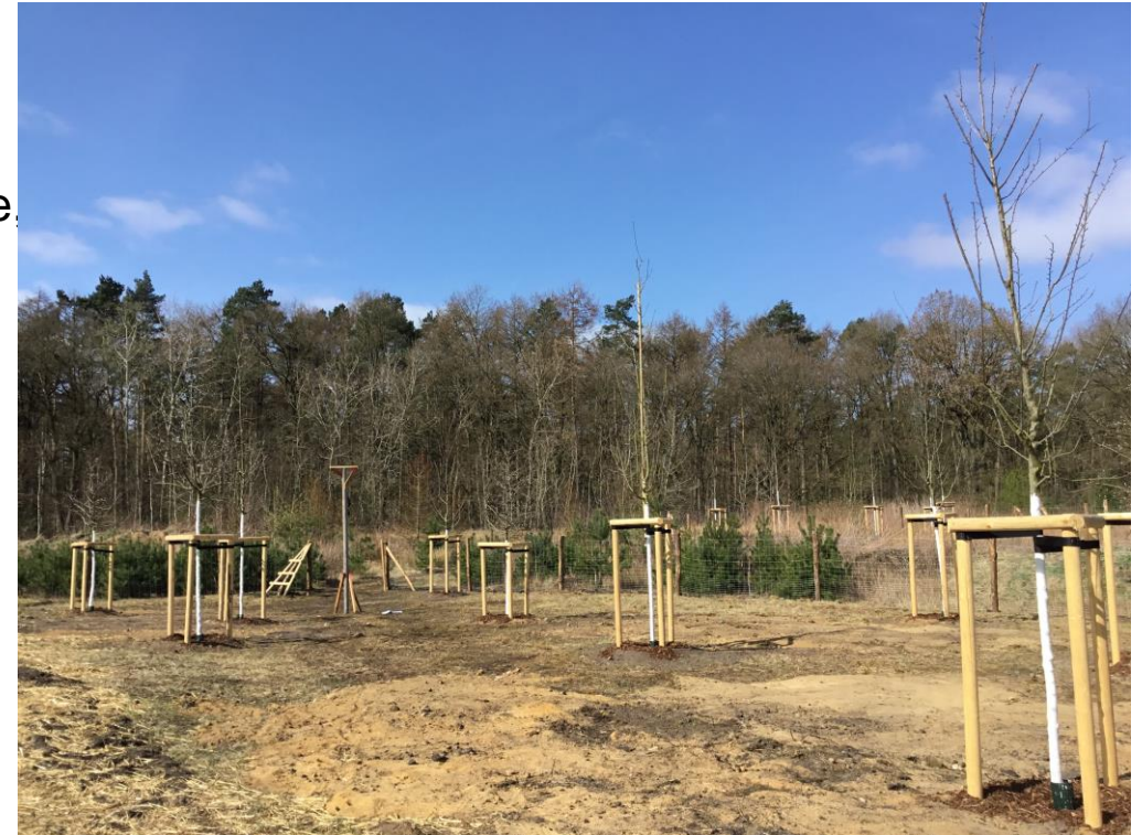
Blick auf die Anpflanzung, Fläche Obstwiese, Zehnergruppe Süd, 2022