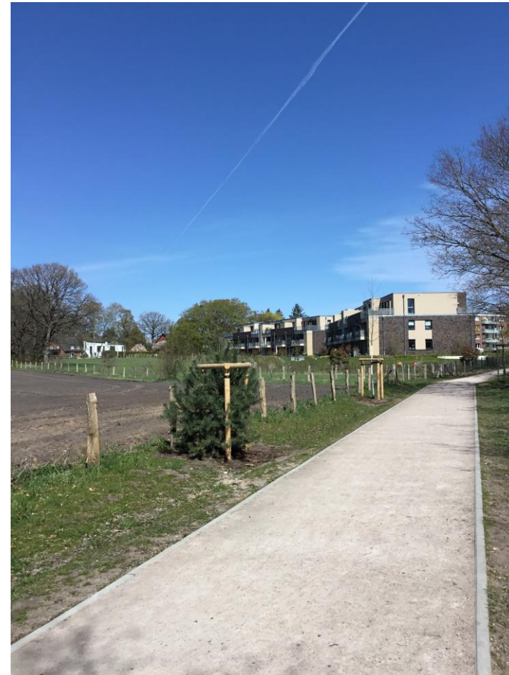
Blick entlang der Wegeverbindung mit Begleitgrün, 2021