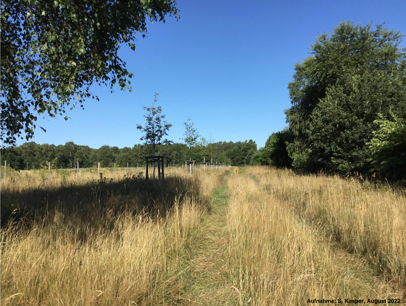
Aufnahme: S. Kasper, August 2022