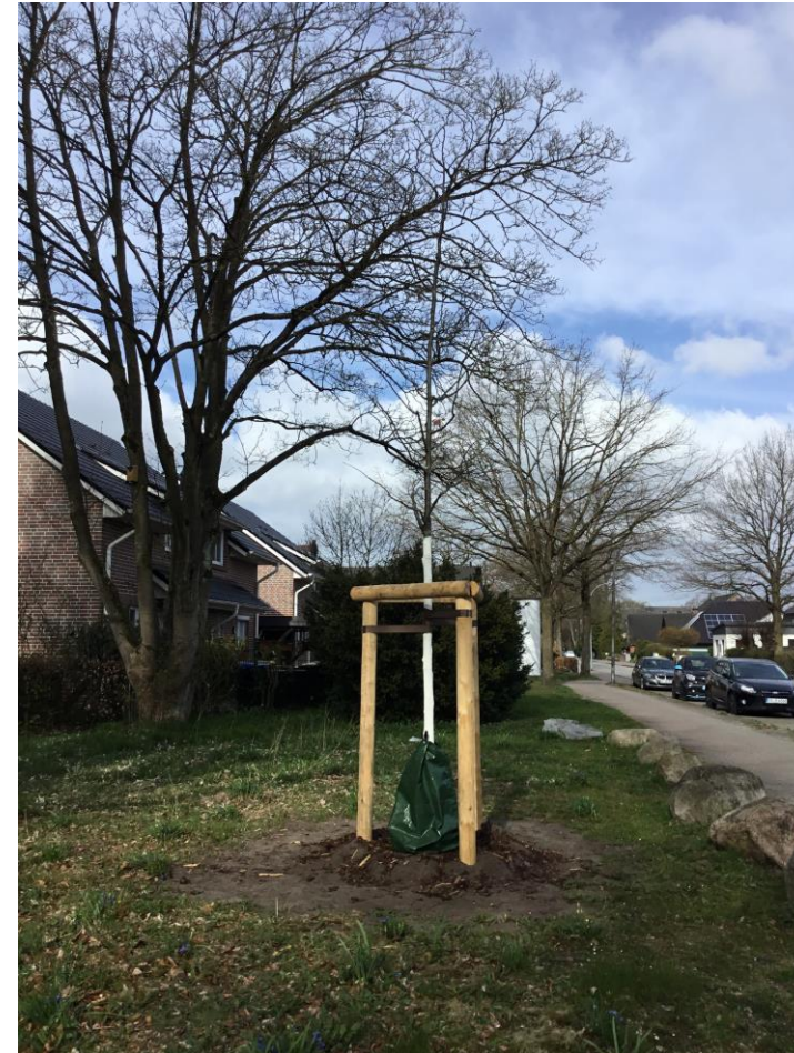
Blick auf neu gepflanzte Eiche, 2021