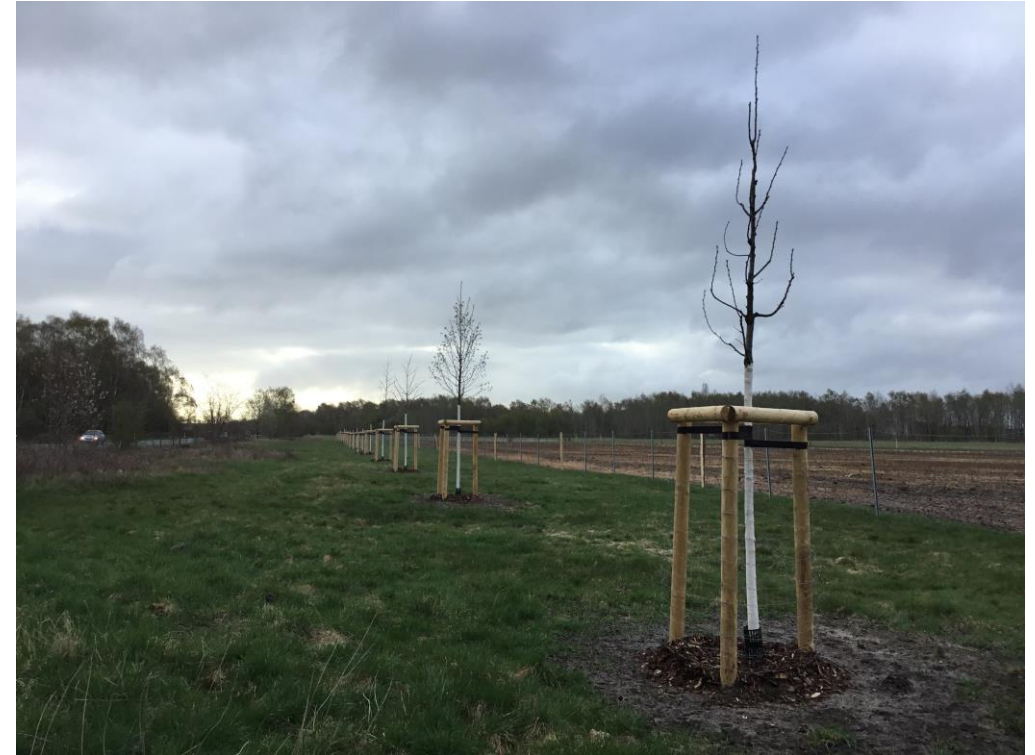
Blick Richtung Süd auf neu die gepflanzte Baumreihe, 2021