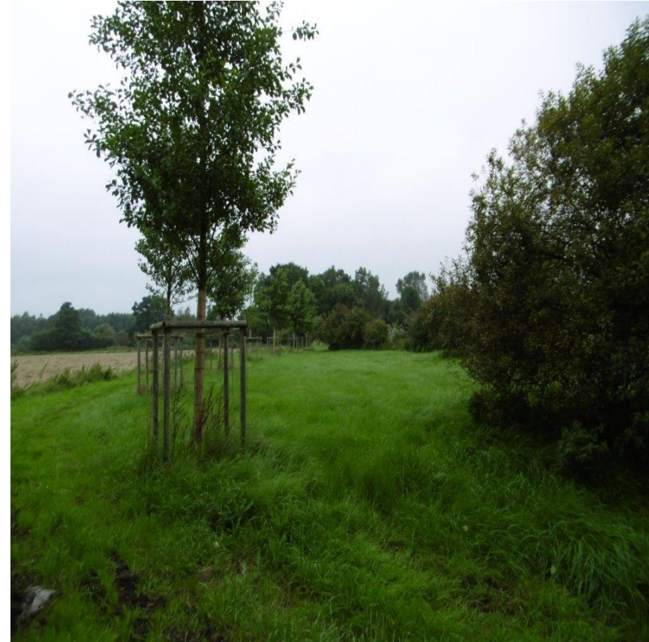
Blick entlang der Fläche, 2017