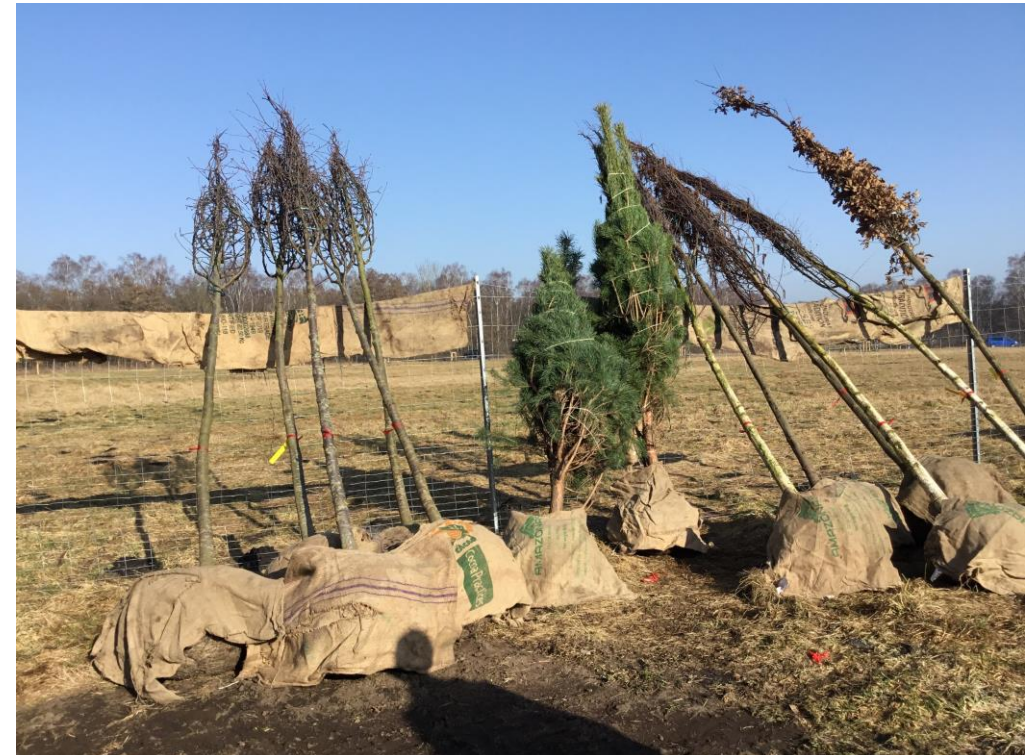
Gerade angekommen: neue Bäume für das Stadtgebiet, Frühjahr 2021