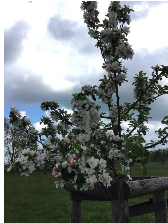
Obstblüte Apfel im Mühlenweg