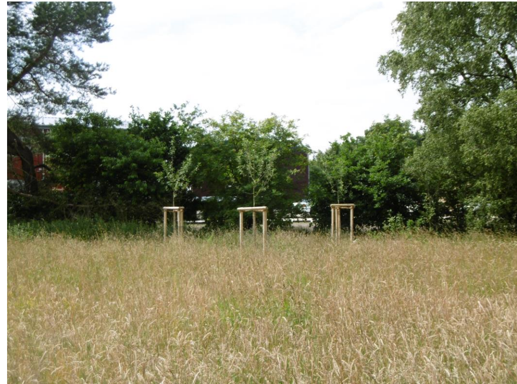
Blick auf einen Teil der Fläche, 2017