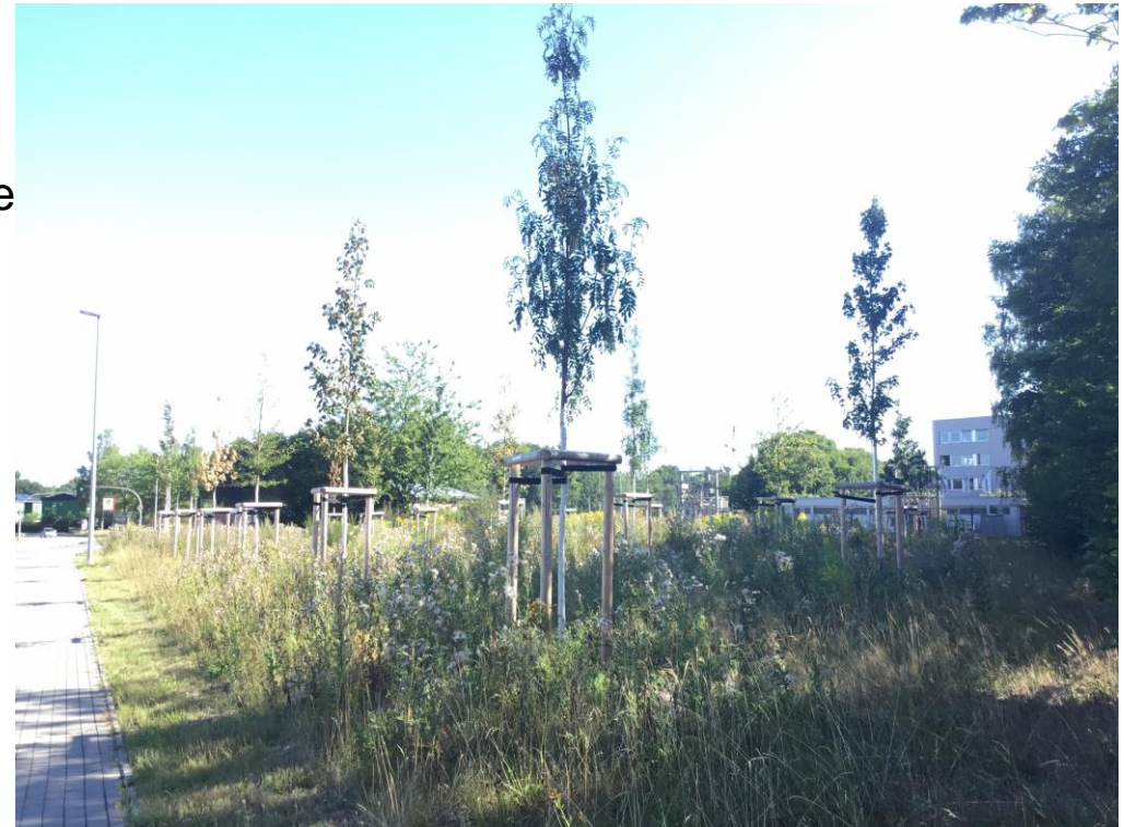
Blick auf die Anpflanzung, August 2022