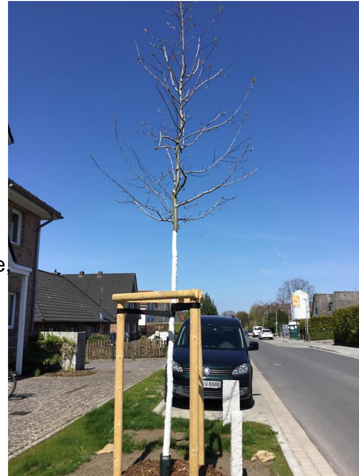
Blick auf einen Hahnensporn, 2022, Am Böhmerwald