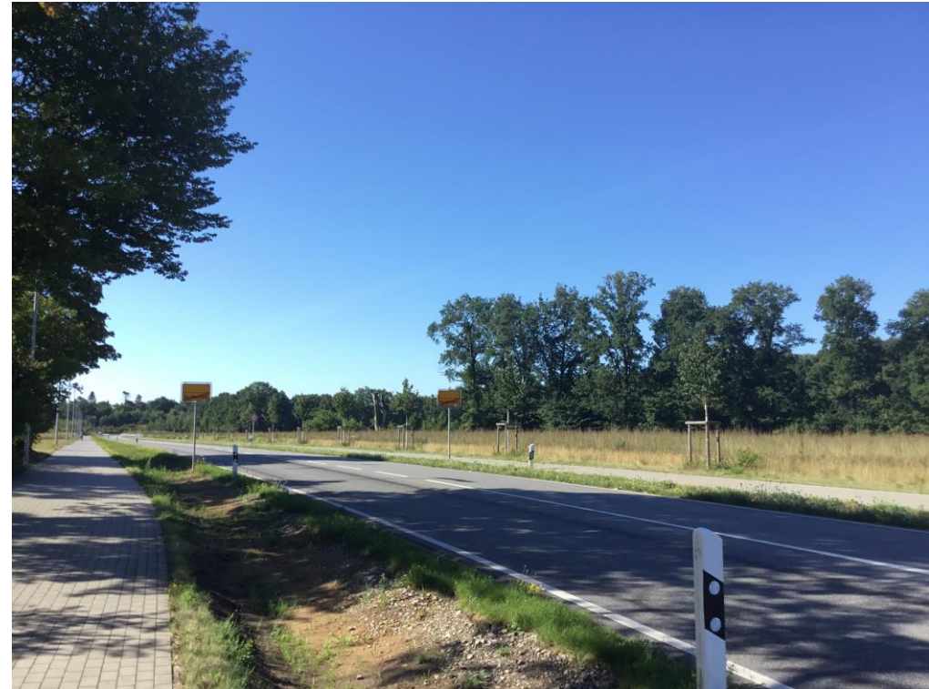
Blick entlang der Straße auf die Ausgleichsfläche und Baumreihe, 2019