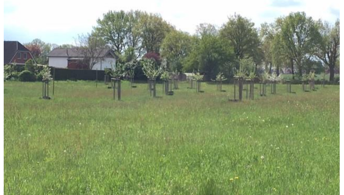
Blick auf die extensiv genutzte Streuobstwiese in der Blüte, 2021