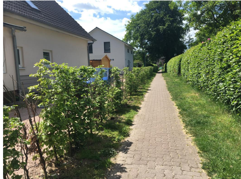
Blick entlang des Weges auf die neu angelegte Hecke links im Bild, 2020, Aufnahme: S. Kasper