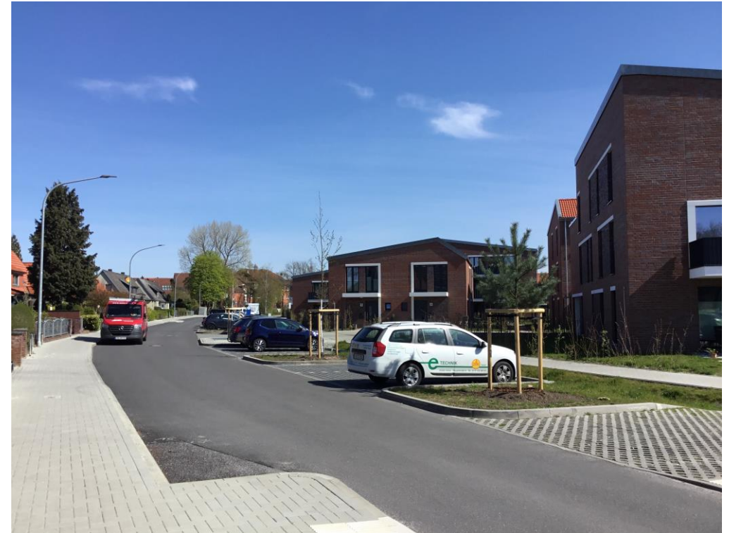
Blick auf den Straßenzug, im Vordergrund eine Kiefer, 2022, Am Böhmerwald, Aufnahme: S. Kasper