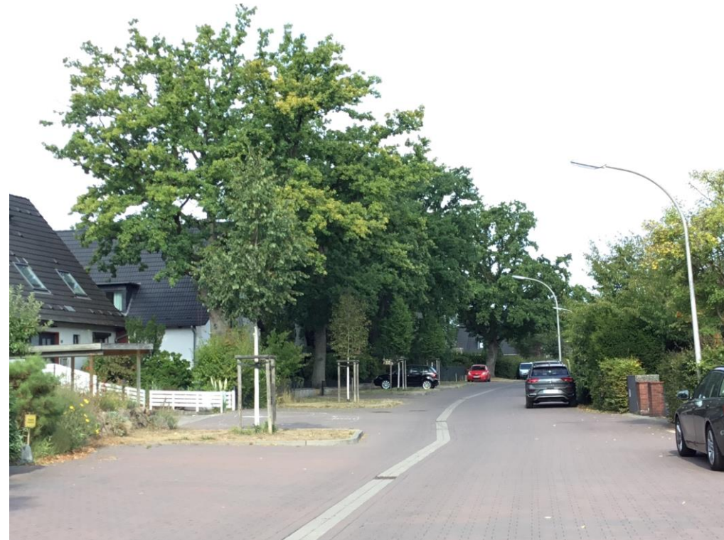
Blick entlang der Straße, 2022