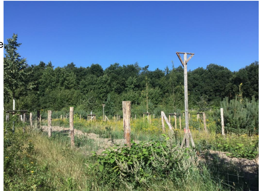
Blick auf die Anpflanzung, Fläche Obstwiese, im Vordergrund der Knick, August 2022