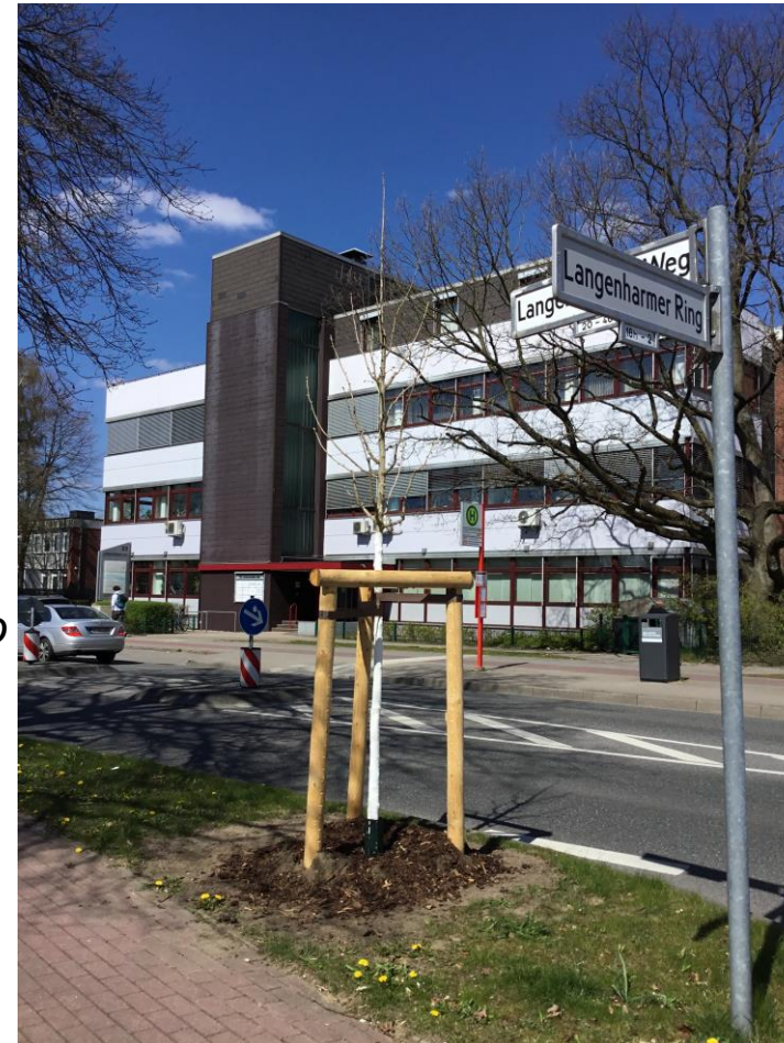
Blick auf neu gepflanzten Baumhasel, 2021