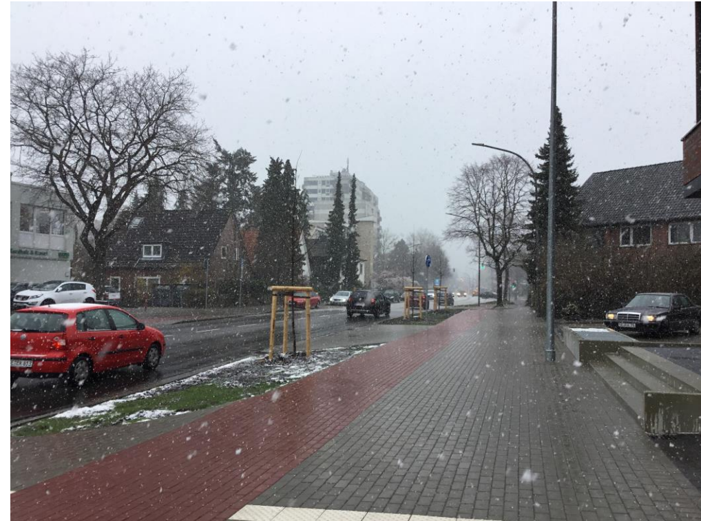
Winterimpression der neuen Bäume, 2021, Aufnahme: S. Kasper