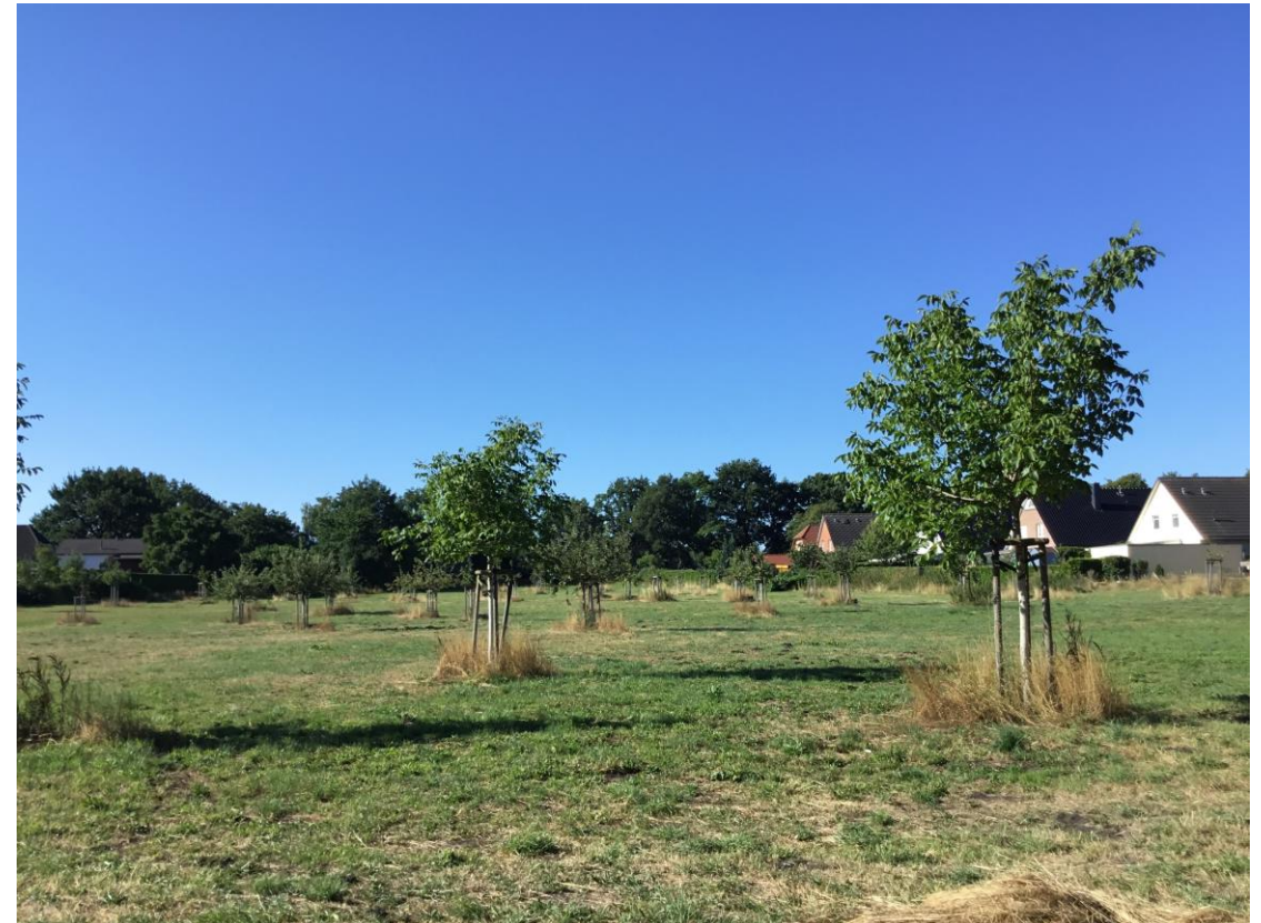
Blick auf die Fläche, im Vordergrund Walnussbäume, August 2022