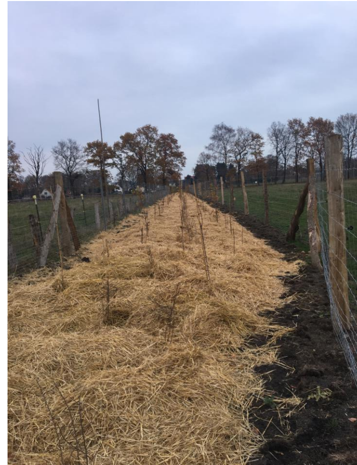
Blick auf die neu angelegte Pflanzung, 2018