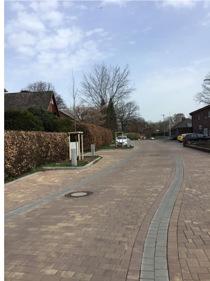
Blick auf den Straßenzug, kleine neue Bäume, 2022, Aufnahme: S. Kasper