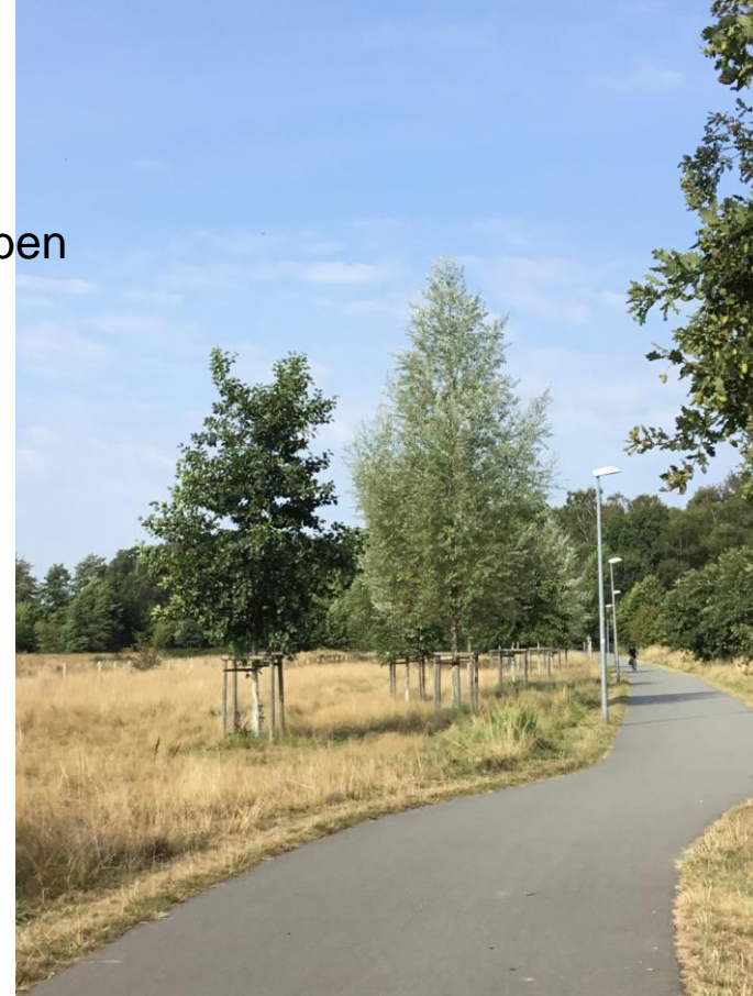
Blick Richtung West entlang des Weges, 2022