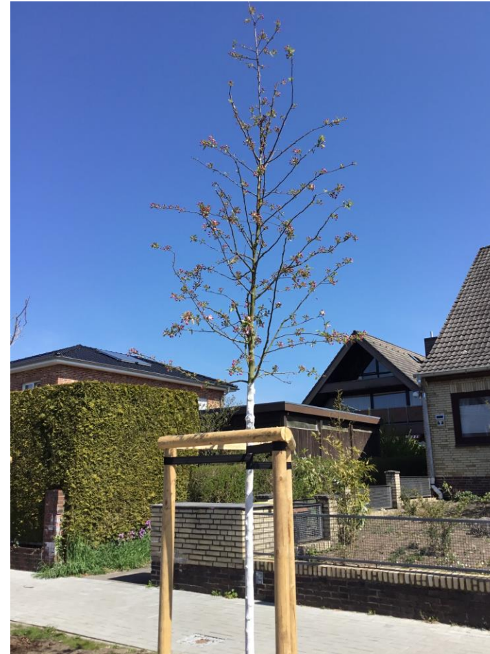
Blick auf einen der Zier-Äpfel, 2022, Am Böhmerwald