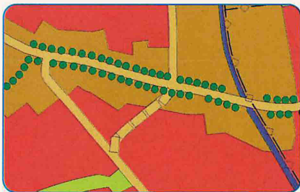
Gemischte Baufläche und Wohnbaufläche