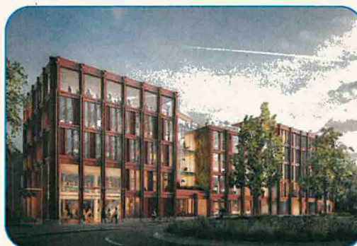
Plambeck Campus – erste Konzeptvisualisierung (Entwurfsstand)