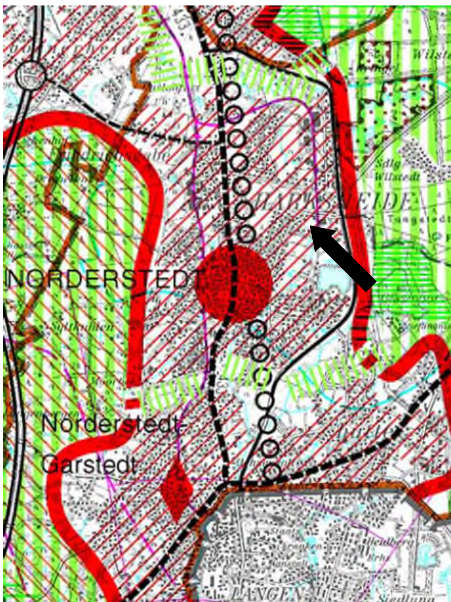
Abbildung 1: Ausschnitt aus dem Regionalplan für den Planungsraum 1 (Fortschreibung 1998), M. 1: 100.000, mit Kennzeichnung Plangebiet (Pfeil)

Im Regionalplan für den Planungsraum 1 (Fortschreibung 1998) liegt das Plangebiet innerhalb der Siedlungsachse Hamburg – Norderstedt – Kaltenkirchen und ist als baulich zusammenhängendes Siedlungsgebiet eines zentralen Ortes gekennzeichnet. Die Stadt Norderstedt ist als Mittelzentrum kategorisiert.