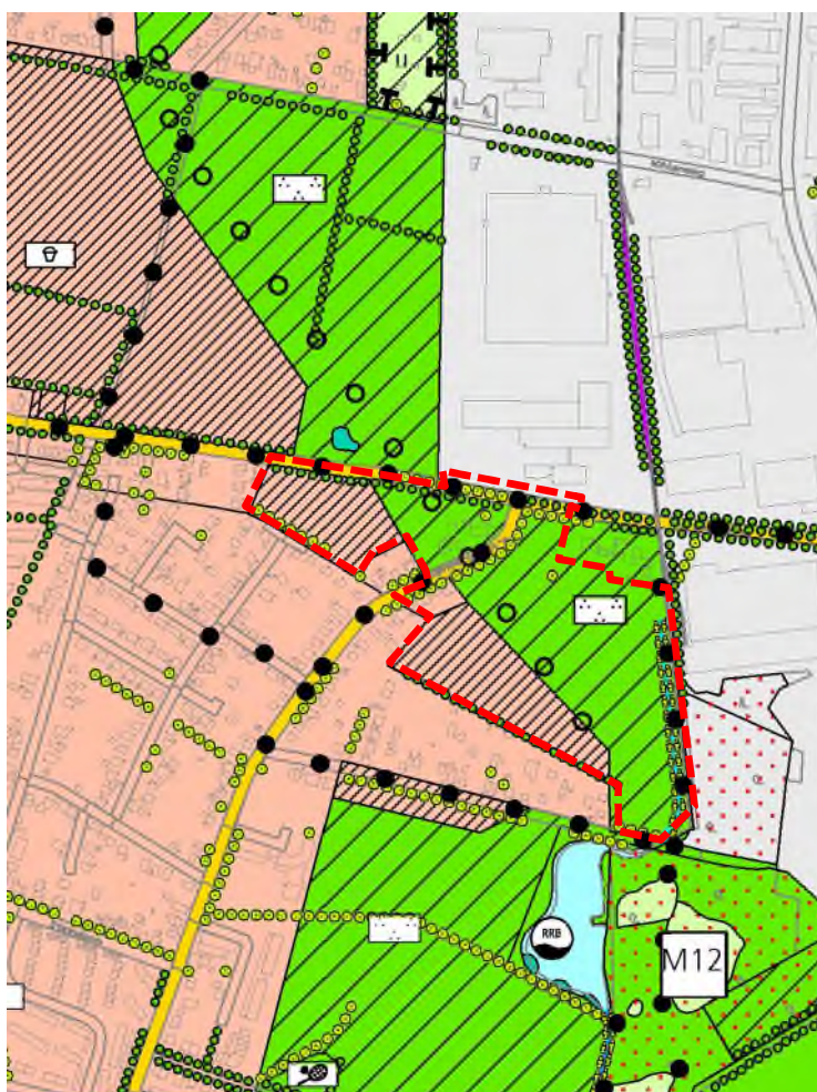
Abbildung 3: Ausschnitt aus dem Landschaftsplan 2020 der Stadt Norderstedt, ohne Maßstab, mit Kennzeichnung des Plangebietes (gestrichelte rote Linie)

Die Ziele des Landschaftsplanes 2020 werden durch das Planvorhaben dieses Bebauungsplanes umgesetzt.