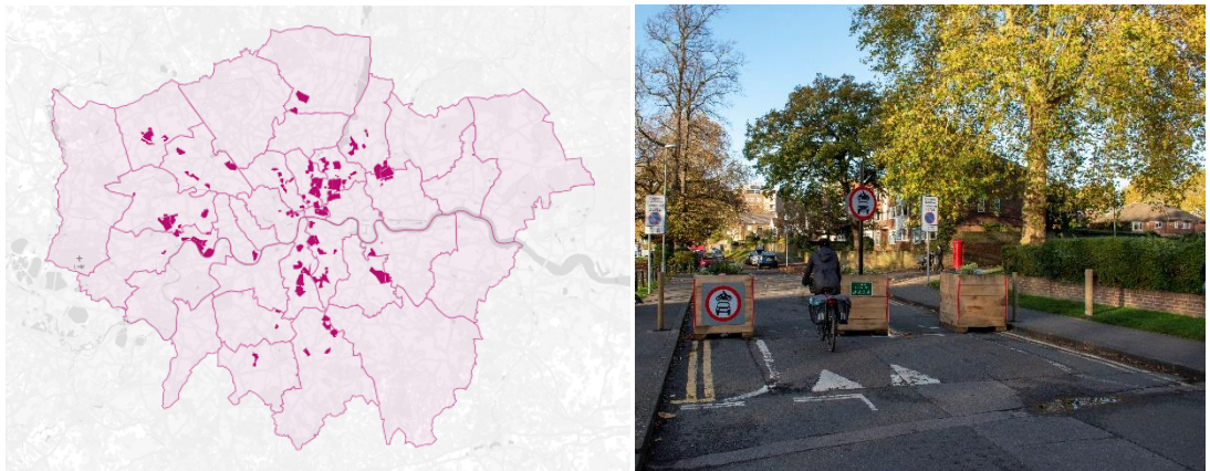
Abb. 2: Low Traffic Neighbourhoods in Londoner Bezirken, umgesetzt zwischen März 2020 und März 2022

Quelle: Aldred & Thomas, 2023 (links); rechts: modaler Filter im LTN Kingston upon Thames; Bild: Jack Fifield via Flickr