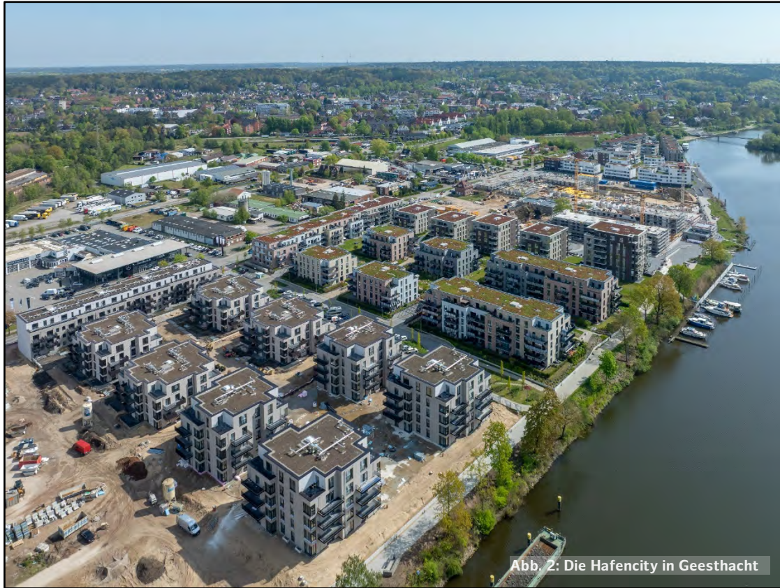
Abb. 2: Die Hafencity in Geesthacht