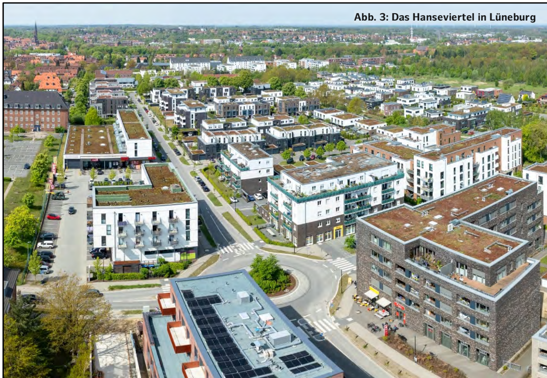
Abb. 3: Das Hanseviertel in Lüneburg