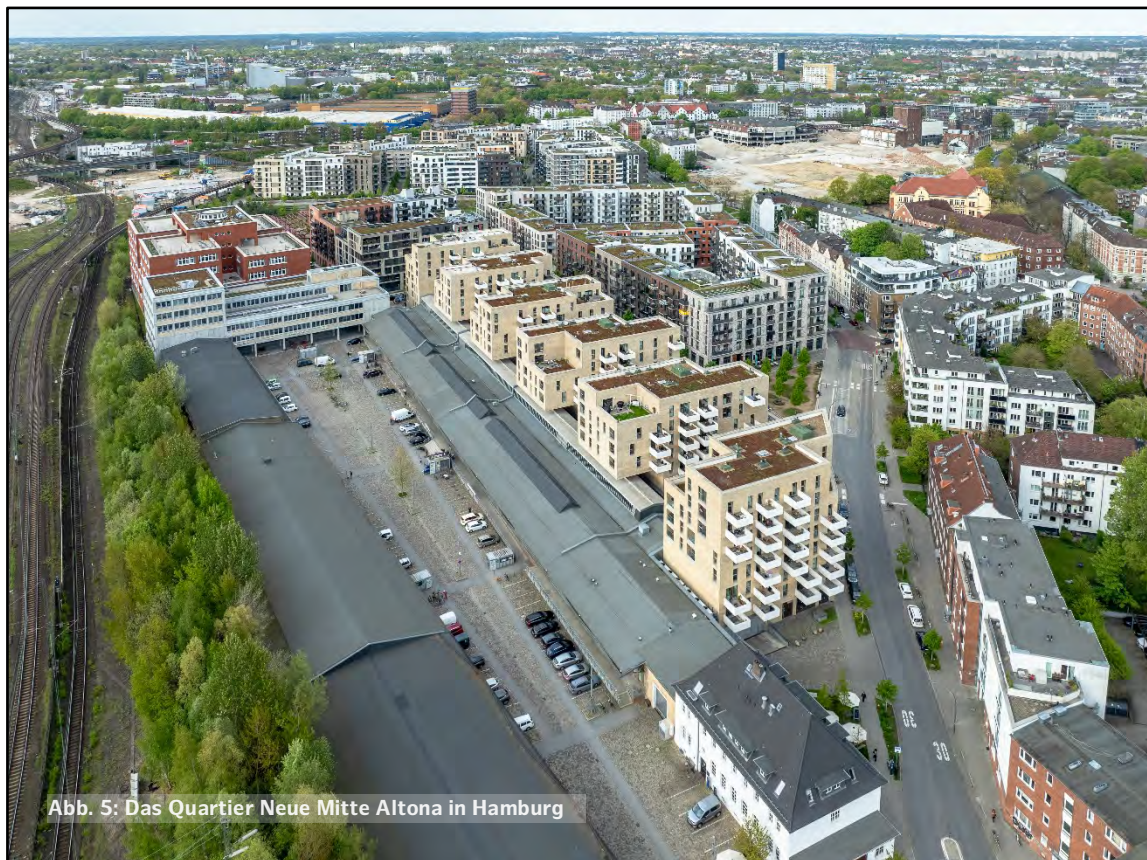
Abb. 5: Das Quartier Neue Mitte Altona in Hamburg