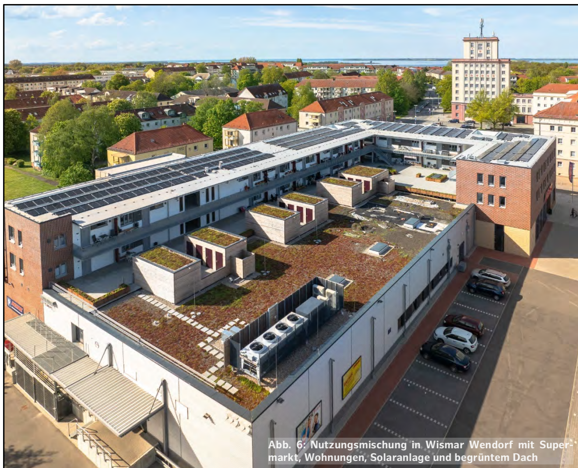
Abb. 6: Nutzungsmischung in Wismar Wendorf mit Supermarkt, Wohnungen, Solaranlage und begrüntem Dach