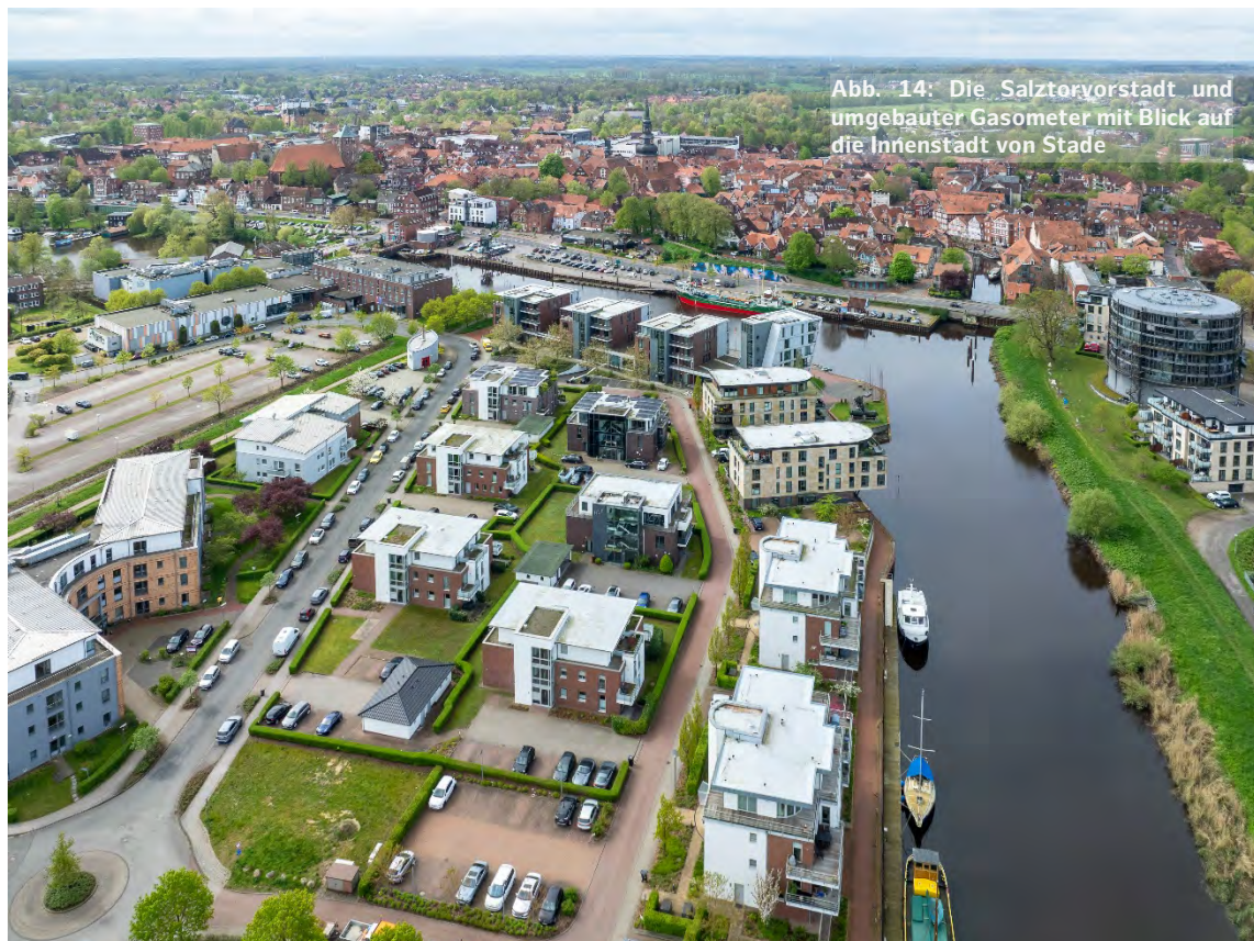
Abb. 14: Die Salztorvorstadt und umgebauter Gasometer mit Blick auf die Innenstadt von Stade

Neben den Innenstädten in den Zentren gehören auch Ortskerne und Bahnhofsumfelder zu strategischen Orten für die Wohnraumentwicklung, gemischt mit Angeboten der Daseinsvorsorge für den täglichen Bedarf. Kommunen mit einer Bahnanbindung können beispielsweise auch den Bahnhof als strategischen Ort in den Blick nehmen und prüfen, inwiefern in dessen Umfeld Nutzungsmischung und Wohnbebauung sinnvoll sein kann. Aber auch Bushaltestellen mit einer gewissen Frequenz und Qualität der überörtlichen Anbindung im ländlichen Raum können als strategische Orte in Frage kommen. Eine Nachverdichtung kann dabei potentiell auch die Fahrgastzahlen und Nachfrage nach ÖPNV-Angeboten erhöhen. Nicht zuletzt gehören zu den strategischen Standorten klassischerweise auch Konversionsflächen im Zusammenhang mit dem Innenbereich und Entwicklungsschwerpunkte gemäß den Raumordnungsplänen. In der Umgestaltung der strategischen Orte ist ein partizipativer Prozess mit Bewohner/-innen, Eigentümer/-innen und Geschäftsinhaber/-innen unerlässlich.