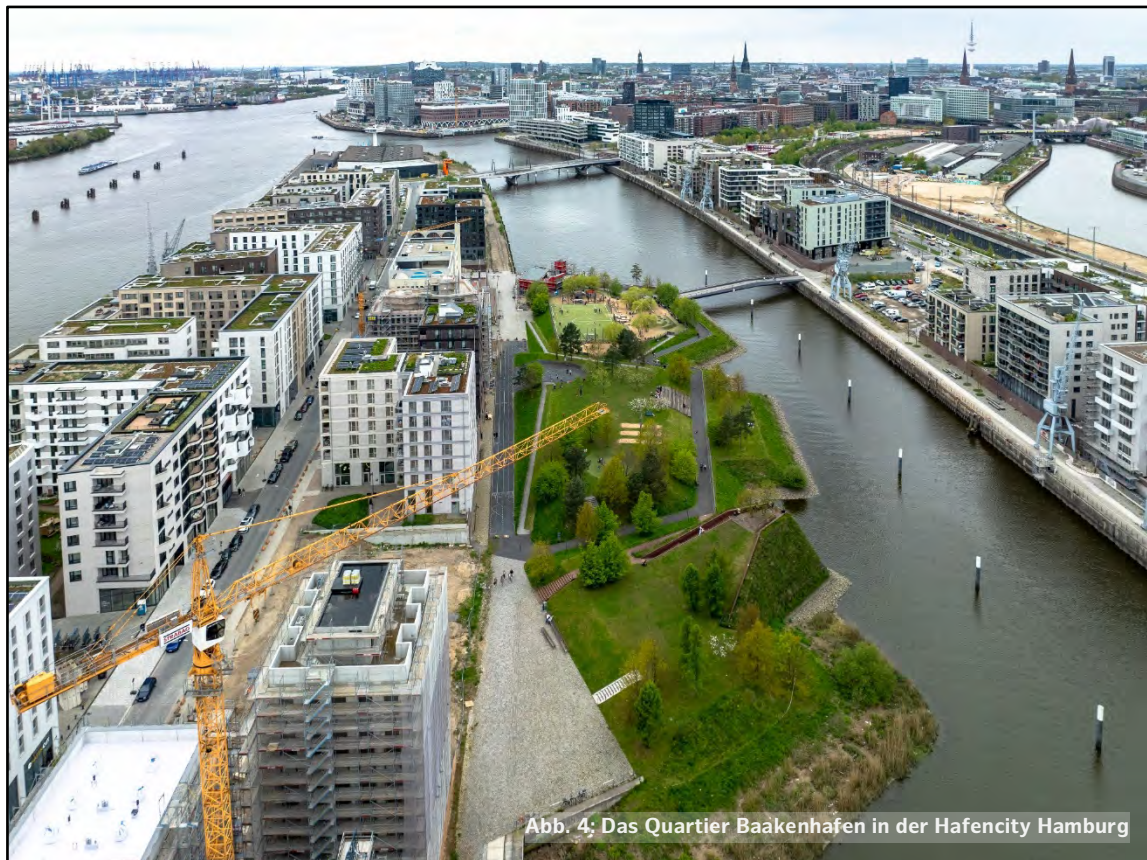
Abb. 4: Das Quartier Baakenhafen in der Hafencity Hamburg