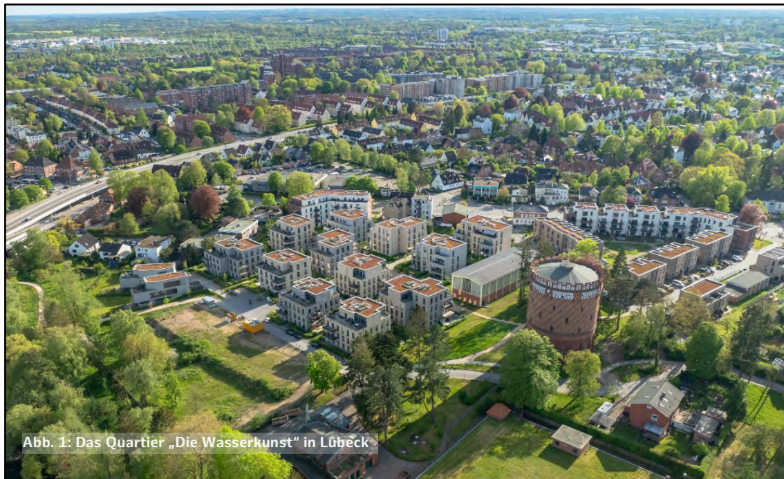
Abb. 1: Das Quartier „Die Wasserkunst“ in Lübeck

Der vorliegende Leitfaden richtet sich dabei prioritär an die kommunale Ebene. Dabei kann ein Leitfaden ein gegenseitiges Angleichen auf kommunaler Ebene ermöglichen und die Überwindung der Fragmentierung durch gemeinsame freiwillige Zielvorstellungen unterstützen. So heißt es im Beschluss des Regionsrates, dass die Entwicklung „gemeinsamer Grundsätze“ eine „bedarfs- und nachfrageorientierte Wohnraumversorgung bis in die Teilräume hinein“ befördern soll. Vorrangig liegt der Fokus daher darauf, Zielvorstellungen davon zu entwickeln, wo und in welcher Qualität neuer Wohnraum geschaffen werden könnte und sollte. Der Leitfaden soll Kommunen ermutigen, neuen Wohnraum an strategisch klug gewählten Standorten im Innenbereich durch eine aktive Bodenpolitik zu entwickeln.