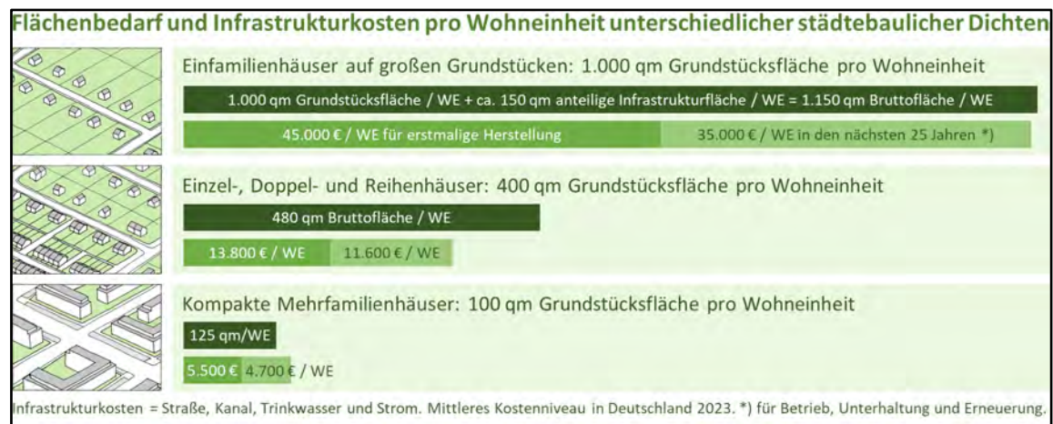
Abb. 20: Gegenüberstellung von Flächenbedarf und Infrastrukturkosten pro Wohneinheit

Der Begriff „Dichte“ wird oft mit „städtischer Dichte“ gleichgesetzt. Dabei ist „Dichte“ nur eine Maßzahl, die beschreibt, in welchem Verhältnis die Gebäudegröße oder die Zahl der Nutzenden zur Grundstücks- oder Quartiersfläche steht. Je höher die Dichte ist, d.h. je mehr Geschossfläche oder Wohnungen pro Hektar Land entstehen und langfristig in der Nutzung bleiben, desto weniger Fläche muss für Siedlung neu in Anspruch genommen werden. Zugleich müssen weniger Straßen, Leitungen und Rohre aus dem Kommunalhaushalt und den privaten Nebenkosten finanziert werden. Städte, Umlandgemeinden und Dörfer haben gleichermaßen ein Interesse daran, ihre Siedlungsstruktur kompakt zu halten, indem sie ortstypische Mindestdichten nicht unterschreiten und Chancen für eine ortsverträgliche Verdichtung nutzen. Vor allem von Einfamilienhäusern geprägte Dörfer und Umlandgemeinden können über kleinere Grundstückszuschneitte und kompaktere Bauformen substanzielle Flächen- und Kostenersparnisse erzielen.