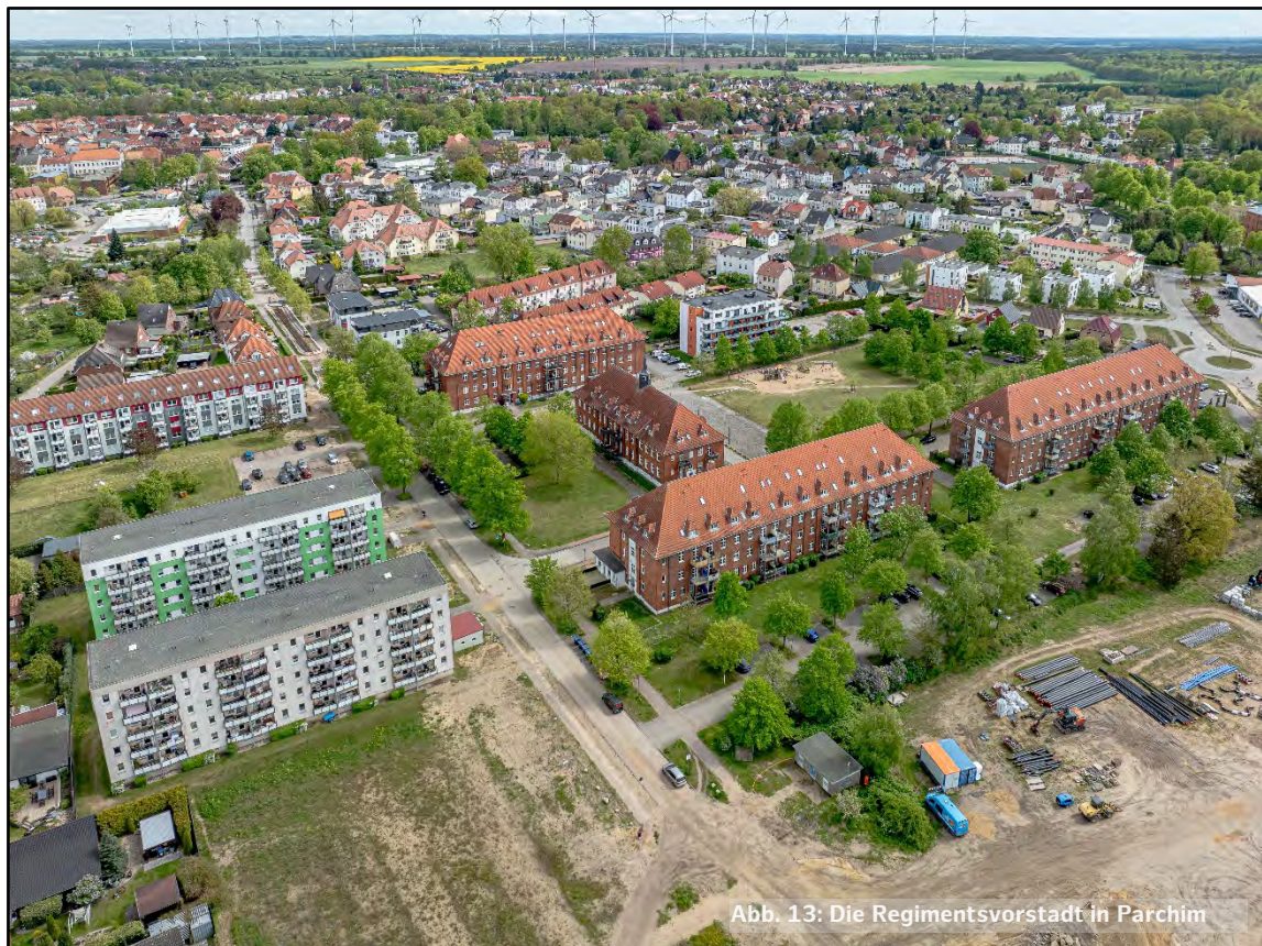
Abb. 13: Die Regimentsvorstadt in Parchim

Durch eine aktive Bodenpolitik wird die gesamte Kommune in den Blick genommen, um Flächenreserven aufzubauen und eine langfristige Strategie für den Umgang mit der begrenzten Ressource Boden zu entwickeln. Über das Vorkaufsrecht können Kommunen sich bestimmte Flächen sichern. Flächen im kommunalen Besitz können später als Konzeptvergabe oder Direktvergabe entwickelt oder für kommunale Zwecke zur Daseinsvorsorge genutzt werden. Dabei kann die Kommune entscheiden, ob sie das Grundstück verkauft oder das Erbbaurecht anwendet. Dies kann durch eine aktive Bodenpolitik in Gang gesetzt werden.