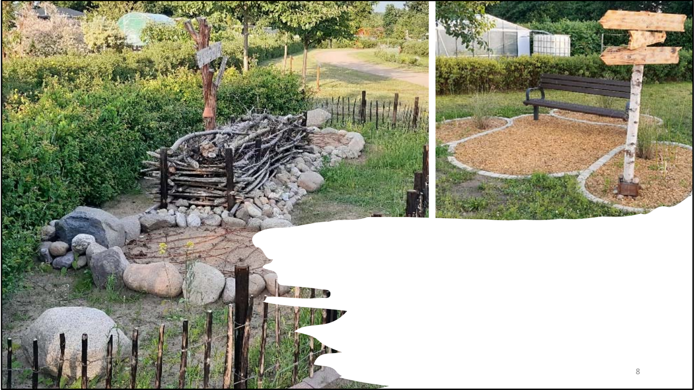
Ruheräume für Besucher und Insekten