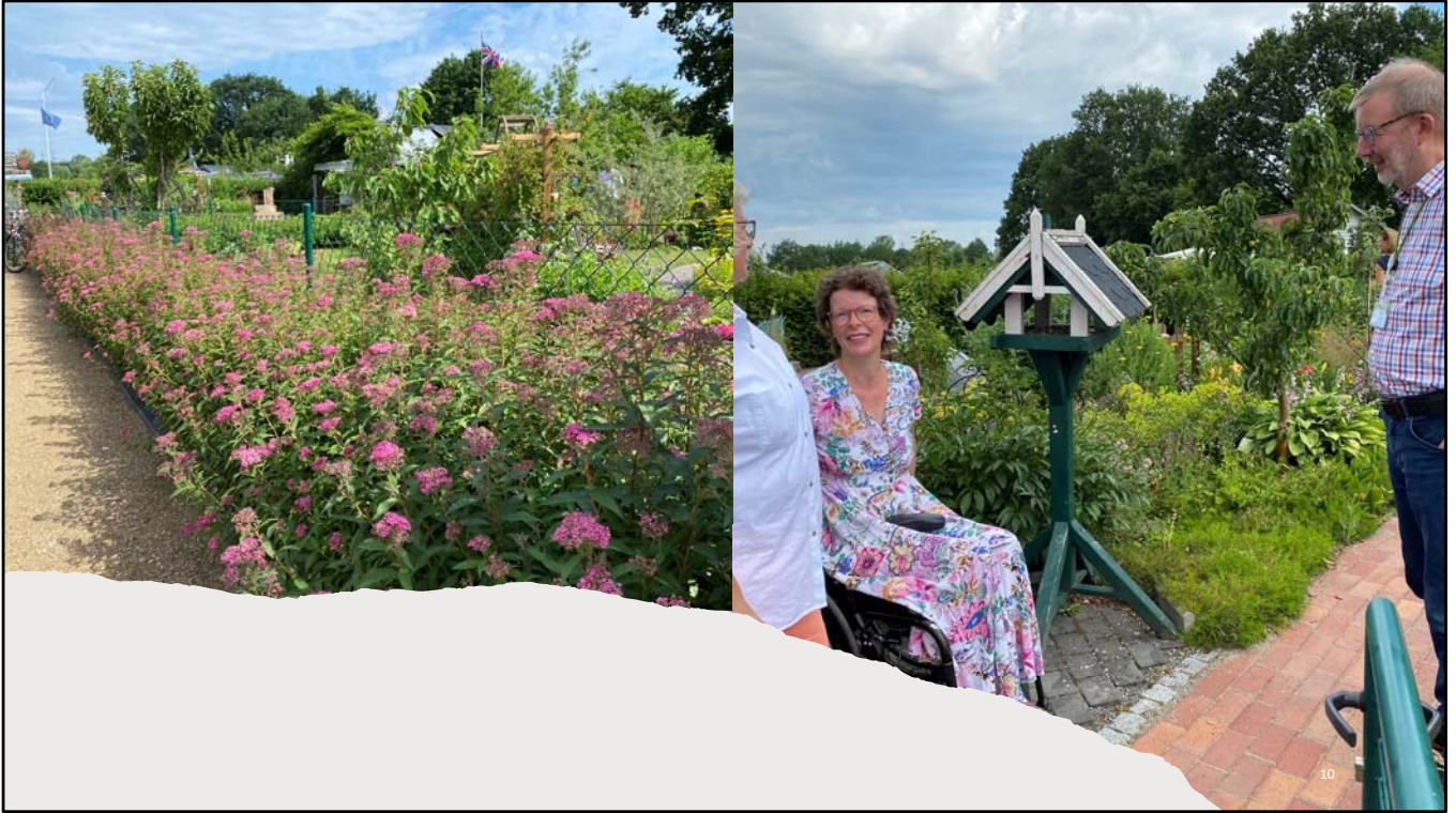
Gelungene barrierefreie Wegeführung, blühende Hecken zur Förderung der Artenvielfalt,