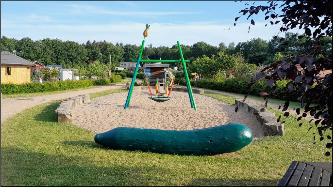
Spielplatz für Junggebliebene