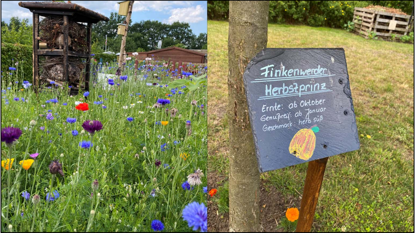
Urban Gardening Projekte