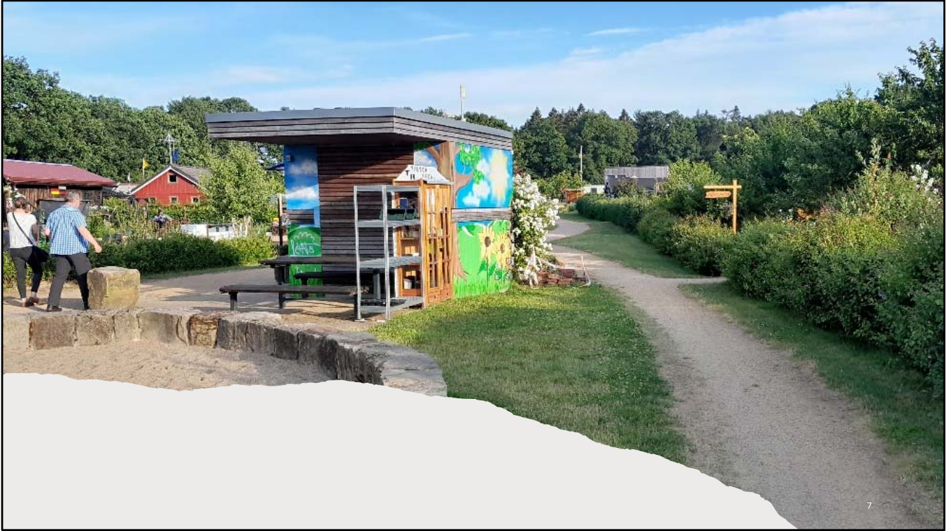
Toilettenhaus mit Tauschregal